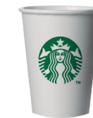
COPO ESPRESSO (4OZ)