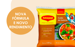
CALDO DE GALINHA MAGGI 1,01 kg