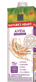
NATURES HEART BEBIDA AVEIA 1 L