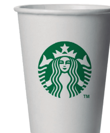
COPO TALL (12OZ)