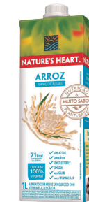
NATURES HEART BEBIDA ARROZ 1 L