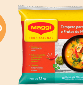
TEMPEROS PARA PEIXES E FRUTOS DO MAR MAGGI 1,1 kg