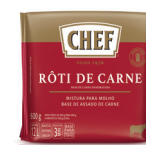
RÔTI DE CARNE CHEF 600 g