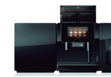
MAQUINA A600 SELF-SERVED