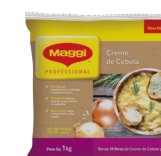
CREME DE CEBOLA MAGGI 1 kg