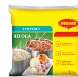
TEMPERO REFOGA MAGGI 1,1 kg