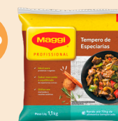
TEMPEROS DE ESPECIARIAS MAGGI 1,1 kg