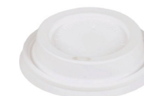
TAMPA TALL (12OZ)