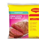
TEMPERO AMACIANTE DE CARNES MAGGI 1,1 kg