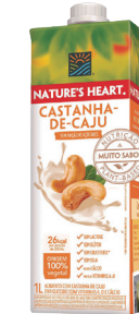
NATURES HEART BEBIDA CAJU 1 L