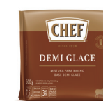
DEMI GLACE CHEF 600 g