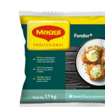
TEMPERO FONDOR MAGGI 1,1 kg