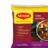
CALDO DE CARNE MAGGI 1,01 kg