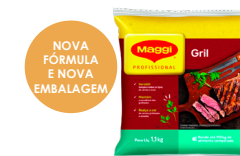
TEMPERO GRIL MAGGI 1,1 kg