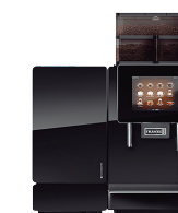
MAQUINA A600 SERVED