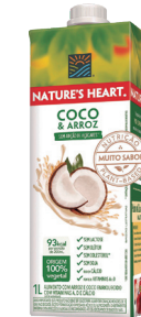
NATURES HEART BEBIDA COCO 1 L